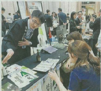
活況を商談会が盛り上げられた会場。バンコク市内のホテル

商談会後には、今年1月6日に開設された北國銀行バンコク駐在員事務所の開設記念レセプションが開かれ、同行と取引のある